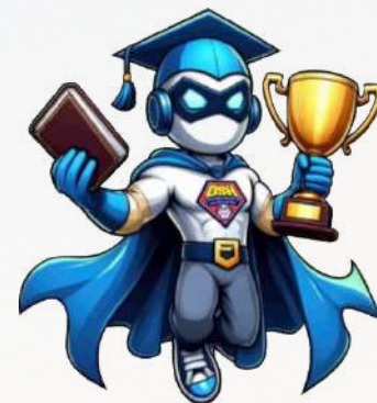
OMNI SCHOLARS HERO